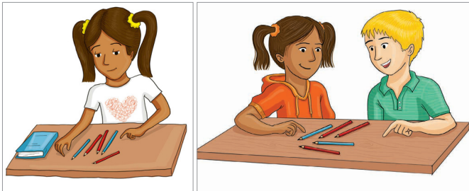
Évolution des illustrations relative à la résolution de problèmes. Celle-ci ne concerne pas que les filles (image de gauche initiale), mais également les garçons (image finale à droite) (MER Mathématiques 3 e , 2019).

Le MER Mathématiques de 3 e année a par exemple fait l'objet d'une relecture finale fine visant à rectifier d'éventuels déséquilibres au niveau de la représentativité des genres ou de la diversité culturelle. Des rééquilibrages ont ainsi pu être réalisés sur différents aspects, comme par exemple le choix des prénoms des personnages