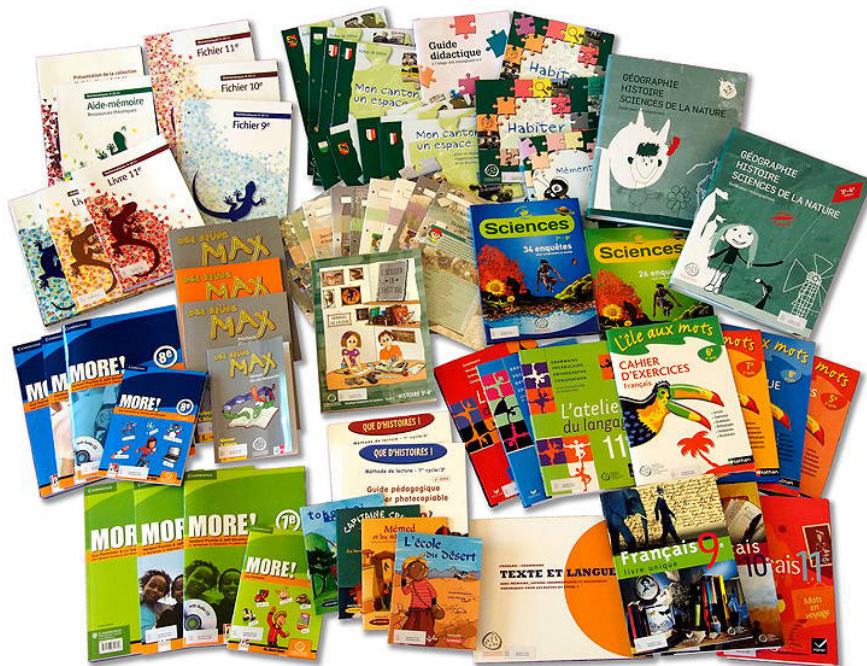
Ensemble des MER à disposition des cantons de Suisse romande – 2018

Le ballon de Manon et la corde à sauter de Noé ; Nanjoud, Ducret, 2 e Observatoire 2018