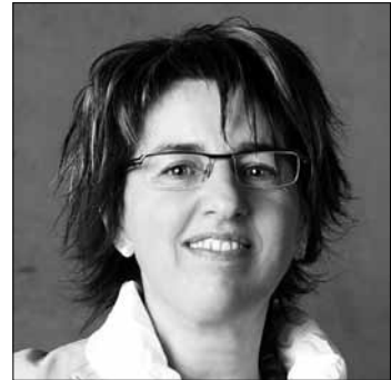
ÉLISABETH BAUME-SCHNEIDER MINISTRE JURASSIENNE DE L'ÉDUCATION PRÉSIDENTE DU CRE