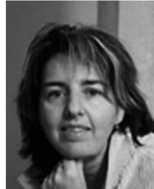
ELISABETH BAUME-SCHNEIDER MINISTRE JURASSIENNE DE L'ÉDUCATION PRÉSIDENTE DU CRE

al. 2 : le Conseil situe son activité dans le contexte général de la politique et du développement de la recherche en éducation en Suisse.