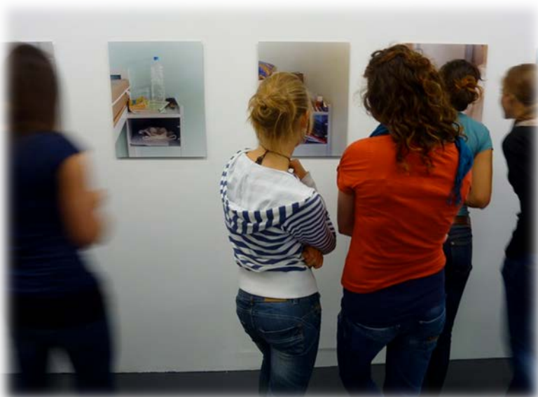
Etudiants dans l'exposition d'Alexander Odermatt, System research # 2 Intimacy , Journées photographiques de Bienne 2009