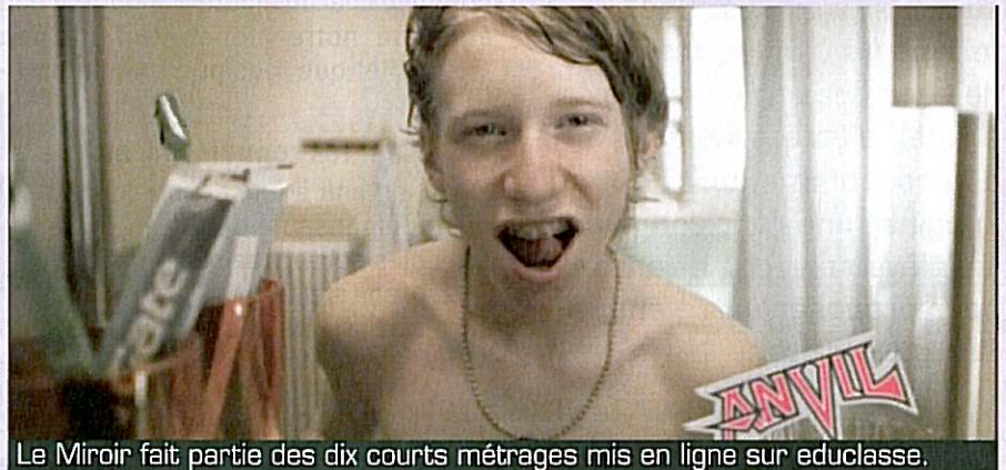
Le Miroir fait partie des dix courts métrages mis en ligne sur educlasse.